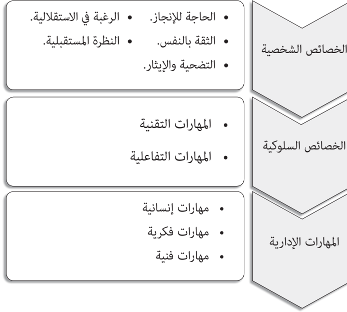
شكل رقم (2) يوضح خصائص رواد الأعمال