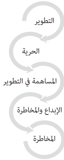
شكل رقم (1) يوضح خصائص ريادة الأعمال